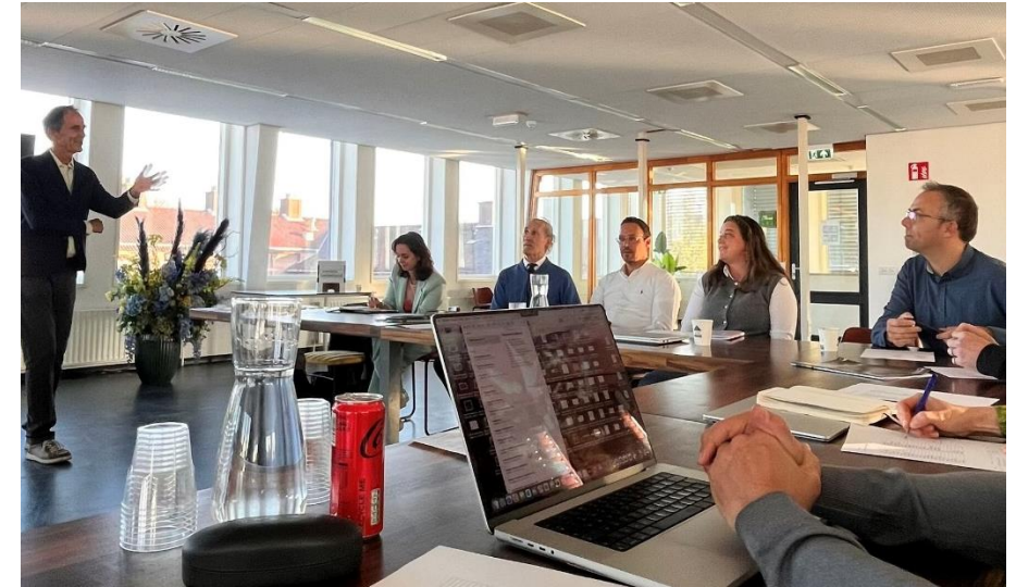
Optop2000 bijeenkomst Wageningen, oktober 2024